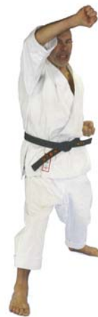
⑨ 🌟 “Ku” Age-Uke mit KIAI!