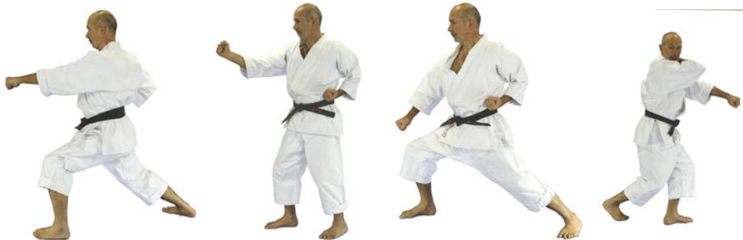
⑤ „Go“ Oi-Zuki

(alle Stellungen der Kata ohne Zusatz sind Zenkutsu-Dachi)