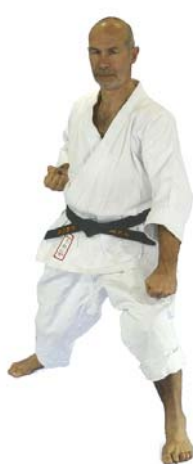
⑥ „Rokk(u)“ Gedan Barai