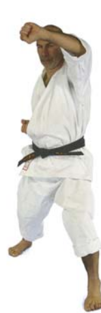
⑧ „Hach(i)“ Age-Uke