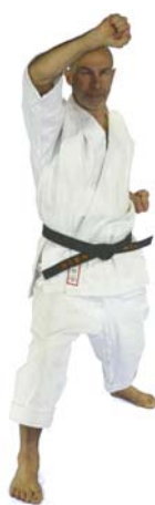
⑦ „Shich(i)“ Age-Uke