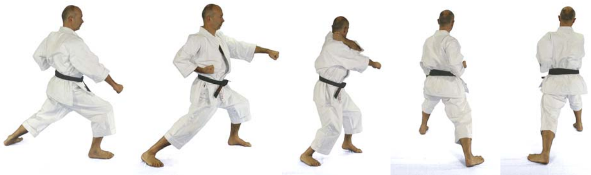
(12) Gedan Barai